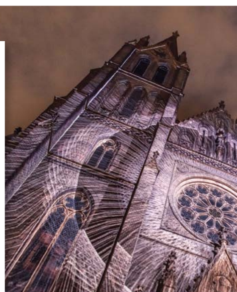
budoucná potvrdit dominantní postavení na trhu v oblasti pronájmu AV technologií.